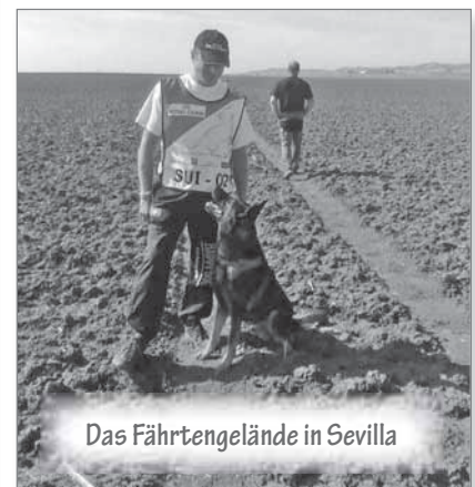
Das Fahrtengelände in Sevilla

Ich freue mich bereits auf die nächste WM. ■