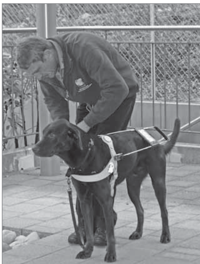
Die Arbeit für den Hund beginnt mit dem anlegen des Geschirrs.

In der Geschichte des Blindenführhundes hatte die Schweiz eine sehr grosse Bedeutung. Es gibt keine Angaben darüber, wann ein Hund zum ersten Mal als Führhund eingesetzt wurde, aber anhand von Abbildungen lässt sich der Hund als Begleiter des Blinden bis in die Antike zurückverfolgen (Wandgemälde aus Herculaneum, 1. Jh. n. Chr.). Es wird vermutet, dass der Hund als Schutz und Gefährte der von der Gemeinschaft