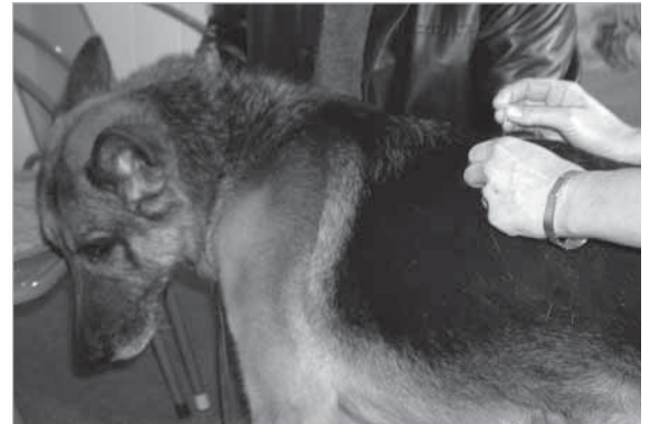
2) und 3) Die Nadeln werden gesteckt,